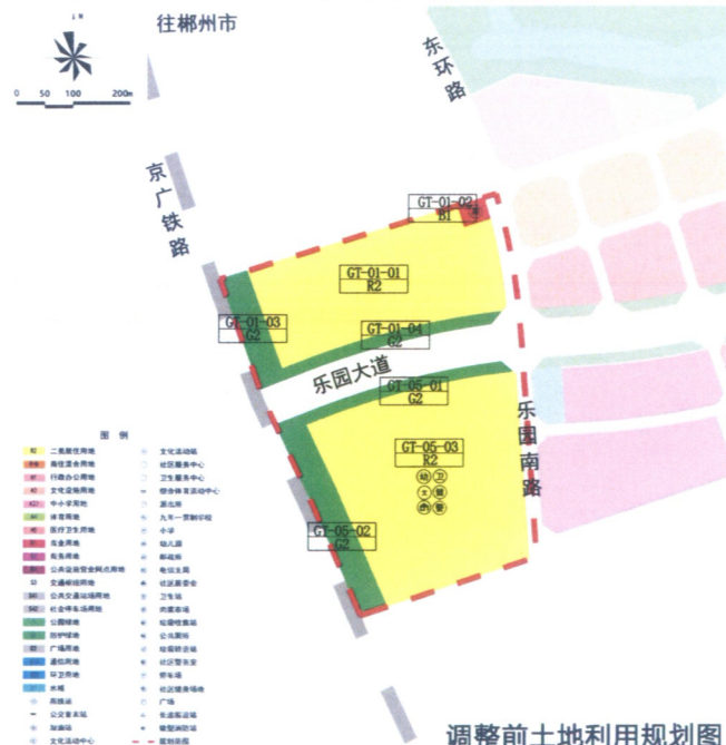
调整前土地利用规划图

将GT-05-03地块拆分为GT-05-03A地块和GT-05-03B地块。其中GT-05-03A地块面积调整为18620.49平方米，用地性质调整为防护绿地（G2），暂不提出容积率、建筑密度、绿地率等指标控制要求；GT-05-03B地块面积为100332.38平方米，用地性质和建筑密度、容积率、建筑高度、绿地率等指标保持不变。