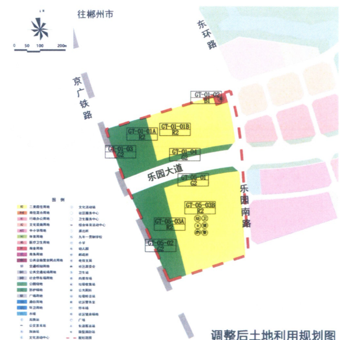
调整后土地利用规划图