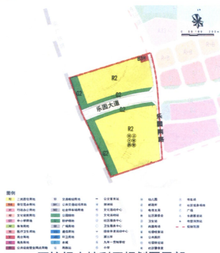
原控规土地利用规划图局部

乐昌东站片区规划为以发展旅游服务、商业商贸、商务办公运动休闲等功能为主的服务型生态城市新区。