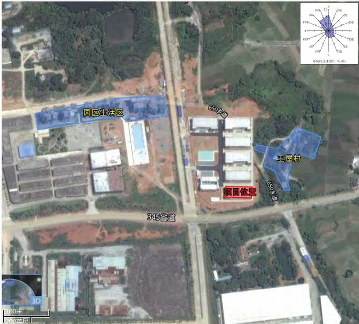
图 5 项目环境敏感点图