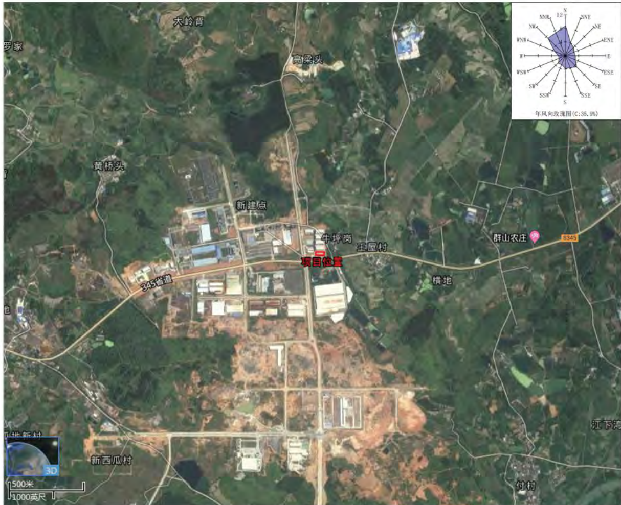
图1 项目地理位置图

表。受建设单位委托，广东韶科环保科技有限公司承担了本项目的环评工作，在收集相关资料及仔细调查研究的基础上，结合本项目所在区域的环境特点，按照环评技术导则的有关要求，编写了本项目的环境影响报告表。