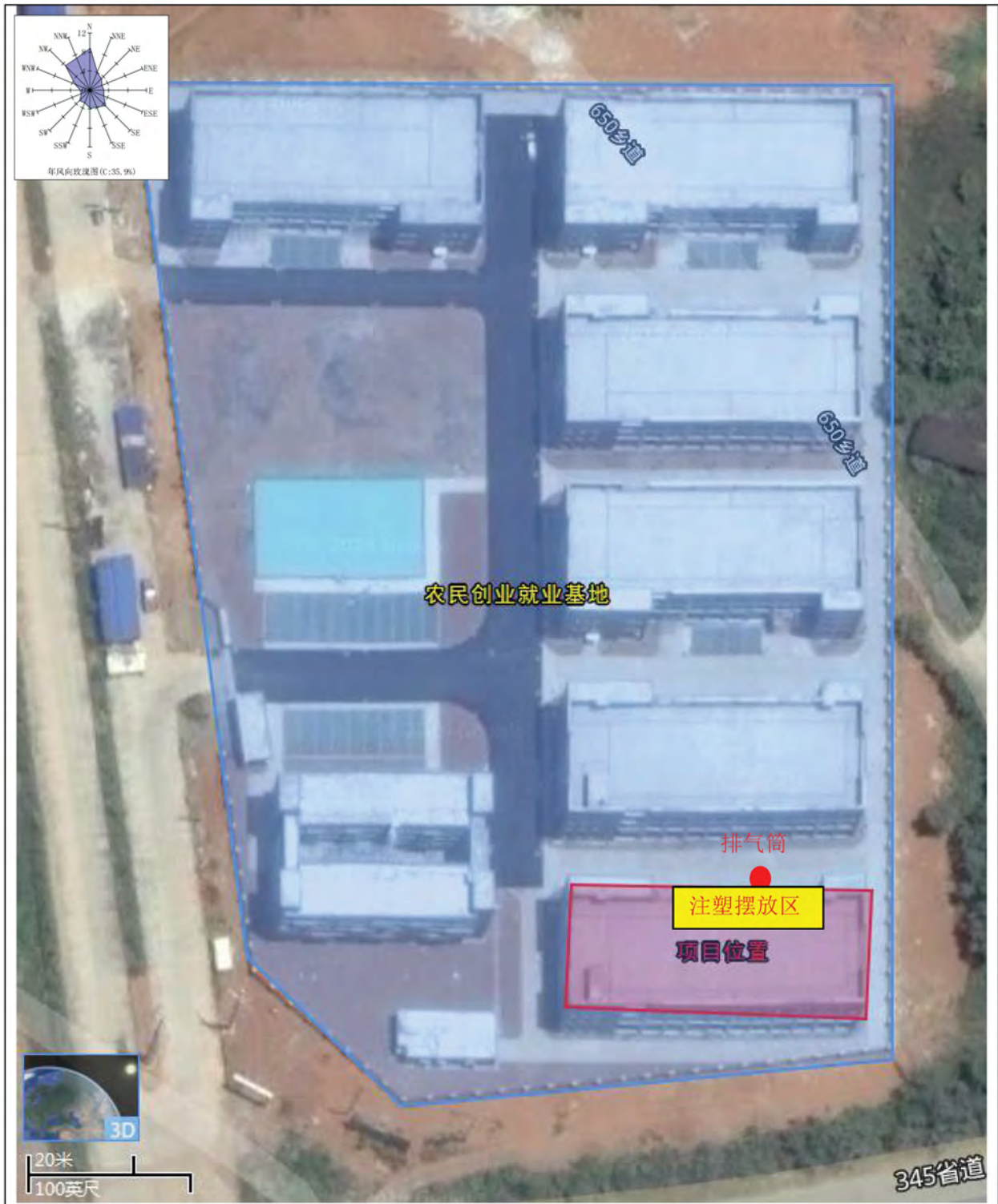
图3 农民创业就业基地标准厂房一号